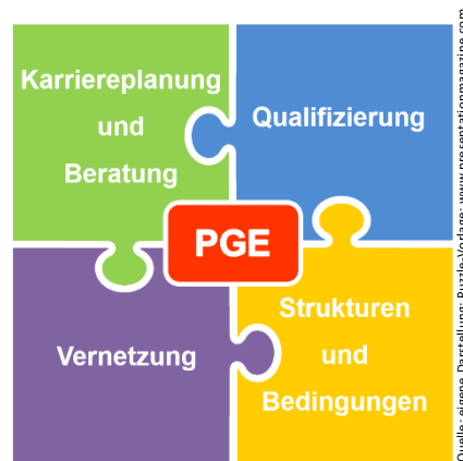
Abb. 1: Die vier Handlungsfelder der Nachwuchsförderung an der TU Berlin

Diese Handlungsfelder sind mit den vier zentralen Qualifizierungsbereichen Forschung, Lehre, akademische Selbstverwaltung und Projekt- und Forschungsmanagement verzahnt, die im Rahmen der Nachwuchsförderung an der TU Berlin verfolgt werden.